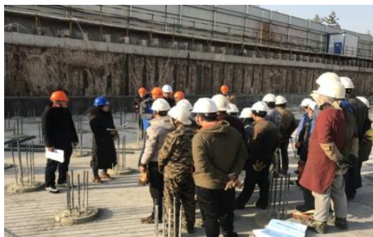
对新进场的工人安全质量技术交底