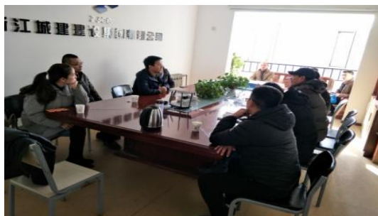
防雷办进行技术交底