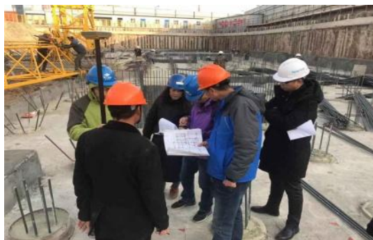
规划局对楼体外框角点复核